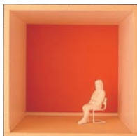
Barwy zimne i jasne odcienie pozornie oddalają pokrytą nimi powierzchnię

Różne odcienie poszczególnych barw mogą modyfikować lub wzmacniać opisane złudzenia. Ciemne odcienie — nawet zimnych barw — będą przybliżać, a odcienie jasne wizualnie oddalą pokrytą nimi powierzchnię.