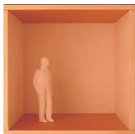
Ciemna podłoga i sufit sprawią, że pomieszczenie będzie wydawało się mniejsze

Opisane właściwości barw i odcieni mogą oprócz rozmiaru zmieniać również proporcje wnętrza. Można na przykład wizualnie manipulować wysokością sufitu. Jeśli pomalujemy go farbą w ciemniejszym odcieniu niż pozostałe ściany, będzie się wydawało, że znajduje się niżej niż w rzeczywistości. Jeżeli do tego podłoga również będzie miała ciemny kolor, wówczas pokój będzie sprawiał wrażenie spłaszczonego. Długi i wąski korytarz będzie się wydawał mniej klaustrofobiczny, jeśli pomalujemy jego ściany na jasny, zimny kolor — który oprócz tego, że wizualnie powiększy przestrzeń korytarza, to jeszcze będzie odbijał wpadające do niego światło.