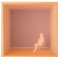
Barwy ciepłe pozornie przybliżają pokrytą nimi powierzchnię do obserwatora

Sposób, w jaki nasze oczy postrzegają kolory i odcienie, pozwala tworzyć iluzje optyczne, które pozornie zmieniają rozmiary pomieszczeń. Ciepłe barwy wizualnie przybliżają pokrytą nimi powierzchnię do obserwatora, natomiast barwy zimne — oddalają. Dlatego też pokój ze ścianami pomalowanymi na brązowo, czerwono czy też, na przykład, na pomarańczowo będzie wydawał się mniejszy niż ten sam pokój ze ścianami pokrytymi farbą w jednym z zimnych kolorów, takich jak błękit czy zieleń.