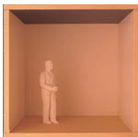
Malując sufit na ciemny kolor, wizualnie go obniżymy

Różne odcienie poszczególnych barw mogą modyfikować lub wzmacniać opisane złudzenia. Ciemne odcienie — nawet zimnych barw — będą przybliżać, a odcienie jasne wizualnie oddalą pokrytą nimi powierzchnię.