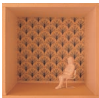
Duże wzory przybliżają powierzchnię, którą zdobią

linie na tapecie czy okładzina drewniana o układzie wertykalnym pozwolą zrównoważyć wrażenie niskiego sufitu. Żaluzje poziome optycznie poszerzą okna, a drewniane podłogi składające się z podłużnych desek będą się wydawały rozciągać w kierunku, w którym będą ułożone. Każdy duży wzór przyciąga wzrok i — w taki sam sposób jak ciepłe i ciemne barwy — pozornie przybliży powierzchnię, którą zdobi. Drobny wzór z kolei sprawia wrażenie, jakby przynależał do większej całości i tym samym nie powoduje wizualnego przybliżenia.