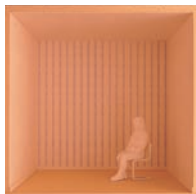
Pionowe pasy sprawiają, że ściana wygląda na wyższą

Zastosowanie linii może również znacznie zmienić postrzeganie przestrzeni we wnętrzu. Pionowe